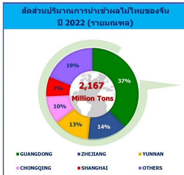
แผนภาพที่ 1 สัดส่วนปริมาณการนำเข้าผลไม้ไทยของจีนปี 2022 (รายมณฑล)