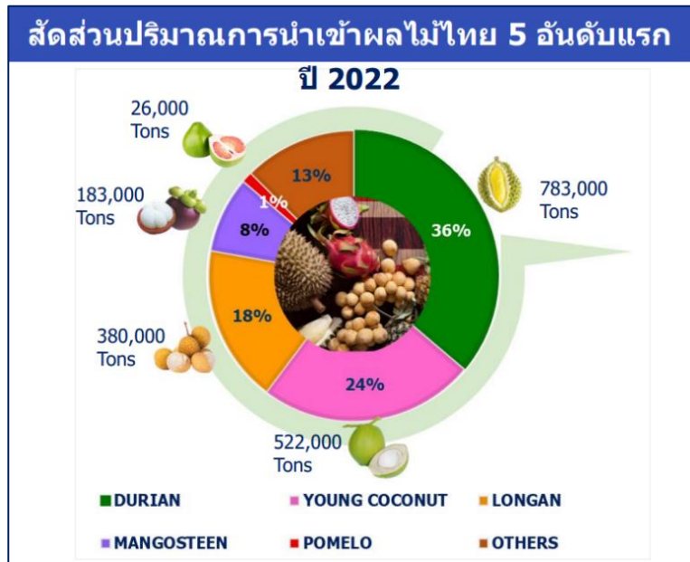
แผนภาพที่ 2 สัดส่วนปริมาณการนำเข้าผลไม้ไทย 5 อันดับแรก